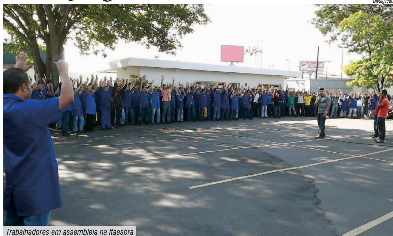
Trabalhadores em assembleia na Itaesbra